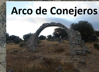
Arco de Conejeros